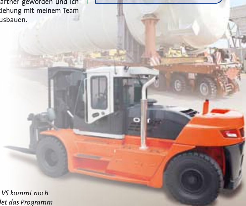
Der neue DV180 VS kommt noch in 2011 und rundet das Programm der Koreaner nach oben ab.